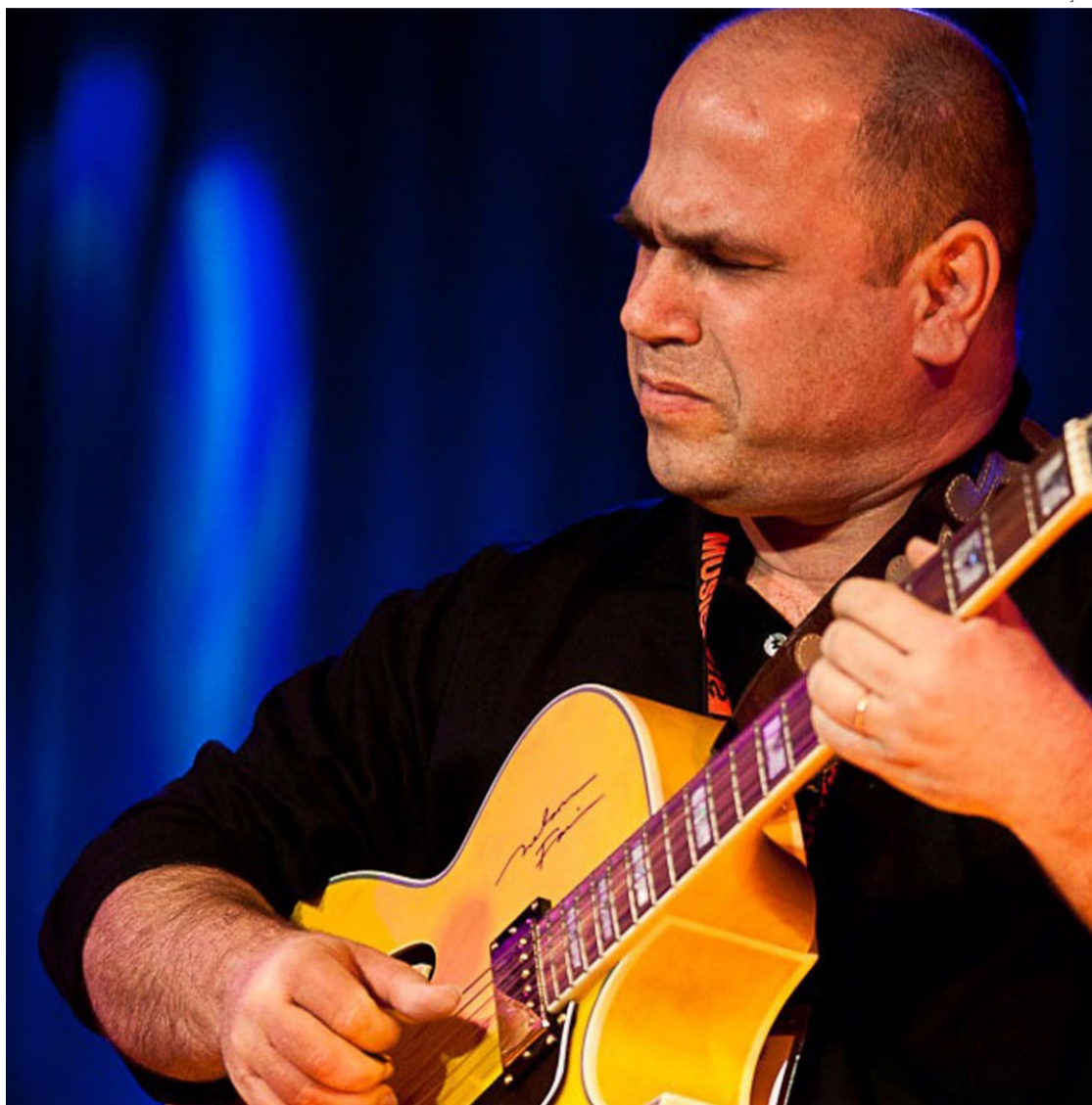
Artista se notabilizou lá fora pela capacidade de criar harmonias e solos complexos

"Lá atrás, quando tive a oportunidade de tocar com a Cássia Eller, era uma situação interessante. Ela era uma amiga daquela época de Brasília e, de repente, de forma inesperada, ela me convidou para tocar com