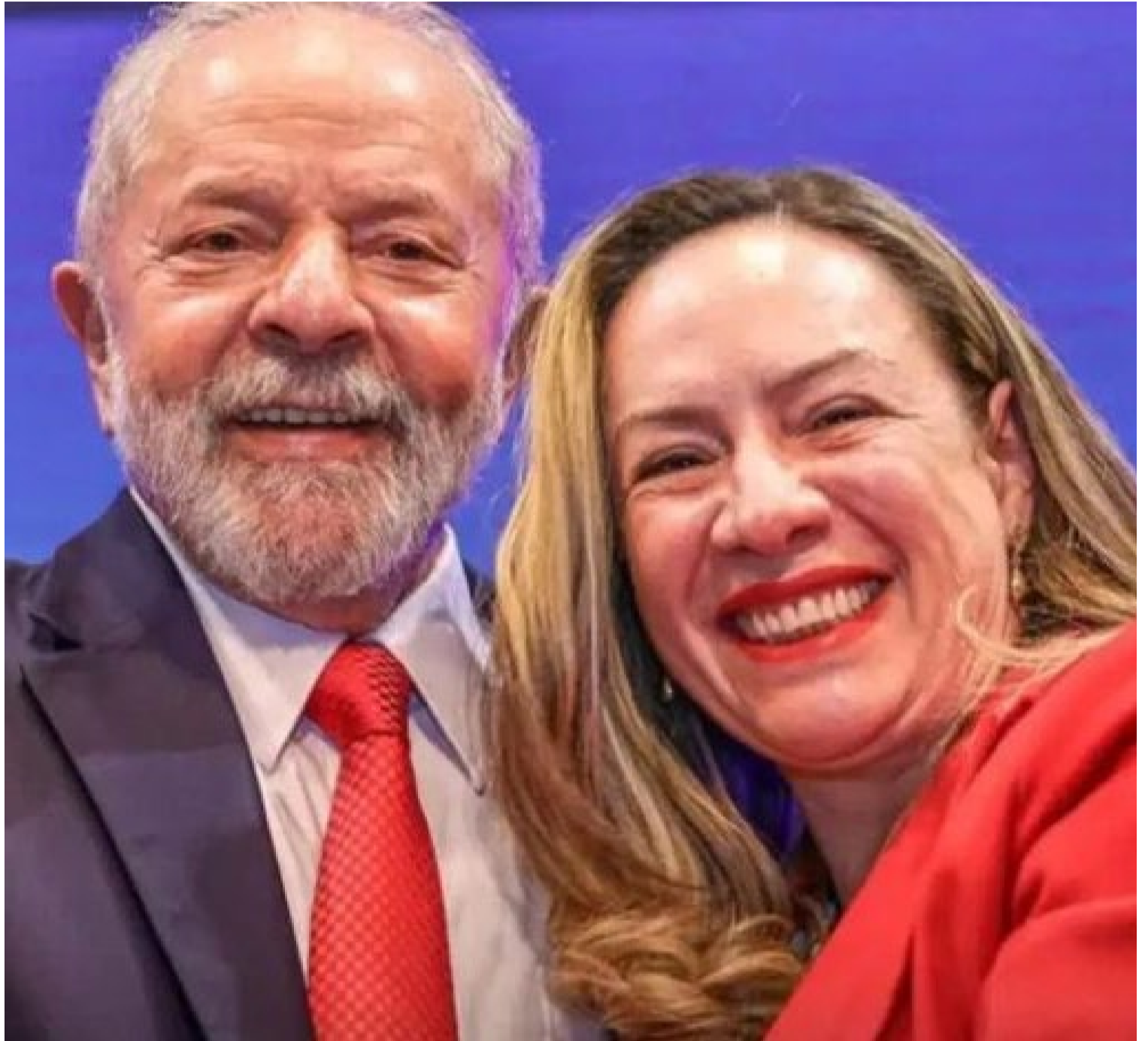
Adriana Accorsi e Lula da Silva: parcerias que beneficiam Goiânia

Com o foco em ter “resultados melhores que em 2020”, quando o partido teve seu pior desempenho em eleições municipais desde a redemocratização, o PT deve ter candidatos em 13 capitais. Segundo as