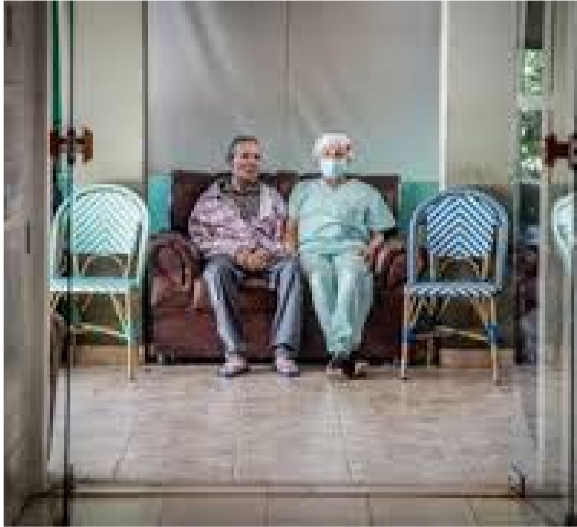
Contingente é maior do que a população de 5.386 cidades do país

O país tinha 160.784 pessoas morando em asilos em 2022, segundo levantamento do Censo 2022 divulgado nesta sexta-feira