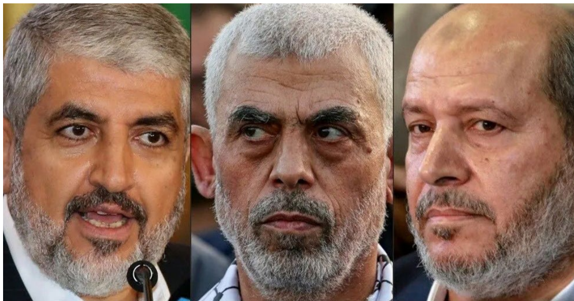
Khaled Meshaal, Yahya Sinwar, et Khalil al-Hayy, líderes da organização terrorista Hamas

A estratégia do Hamas se baseia em vários pontos-chave. Primeiramente, a organização planeja manter pressão psico-