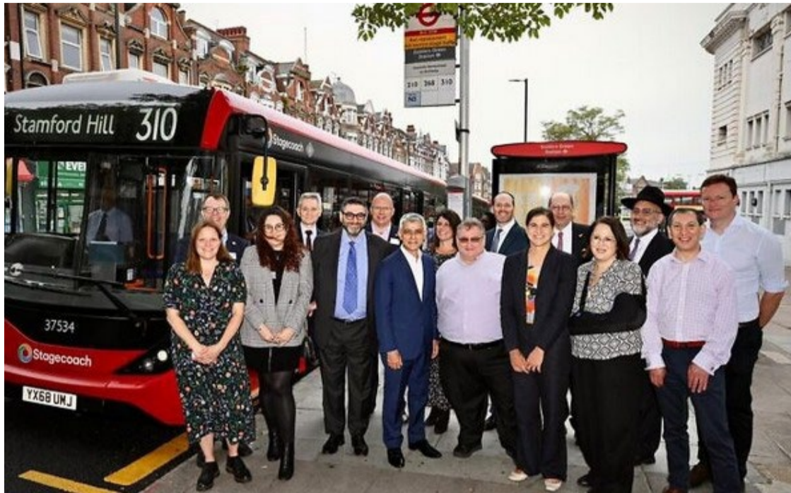
Nova linha de ônibus conecta diretamente dois bairros com grande população judaica na capital britânica

balhista, afirmou que a iniciativa responde a pedidos de famílias que se sentiam ameaçadas durante o trajeto. "Famílias me contaram que, ao trocar de ônibus entre Stamford Hill e Golders Green em Finsbury Park, ficavam assustadas com