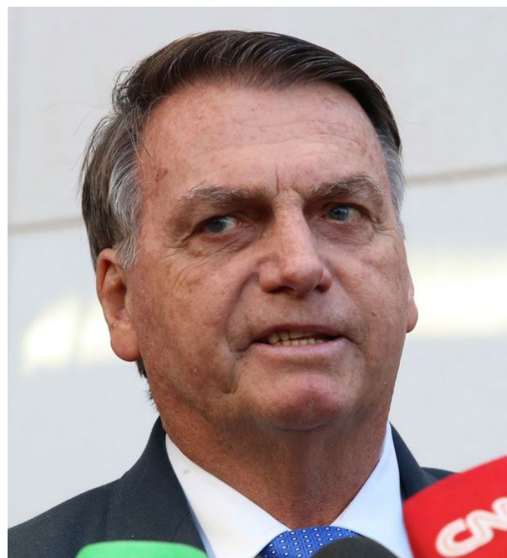
Jair Bolsonaro lidera ato de protesto em São Paulo contra Alexandre de Moraes

Destá vez não houve proibição para cartazes na manifestação, diferentemente dos atos anteriores. Em fevereiro, havia o temor de que faixas contra Moraes aumentassem a pressão para uma possível prisão de Bolsonaro. “O povo é livre. É uma manifestação pelo estado a liberdade, e eu não vou impedir [as pessoas de levar o que quiserem]”, disse Malafaia.