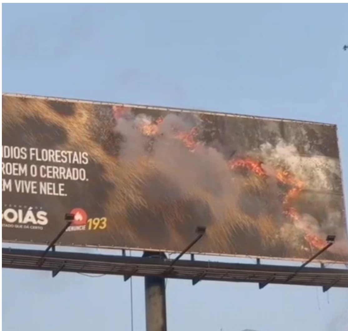
Campanha de combate aos incêndios chega em outdoors de Goiás: Cerrado em chamas

A campanha apresenta, de forma realista, o impacto de perda da biodiversidade com