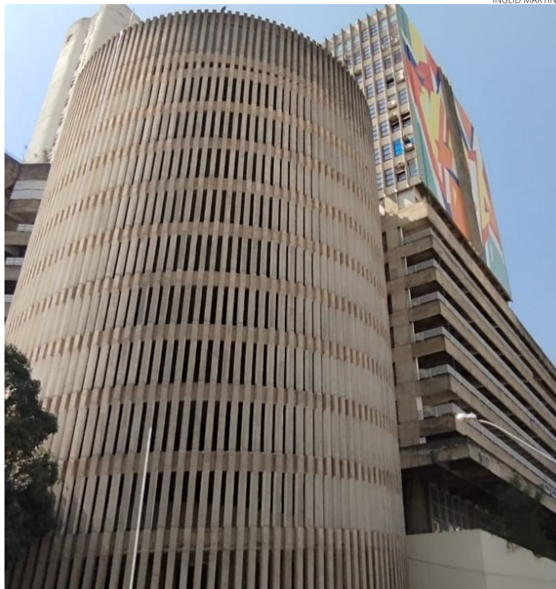
Na Rua 4: Parthenon Center se ergue imponente com linhas retas, formas geométricas e concreto

Atualmente, o edifício exemplifica a divisão entre propriedades públicas e privadas. A parte pertencente ao Estado abriga funções culturais e educacionais, como a Escola de Artes Visuais, que oferece cursos gratuitos e passou por uma grande reforma, e várias galerias de arte administradas pela Secretaria de Estado