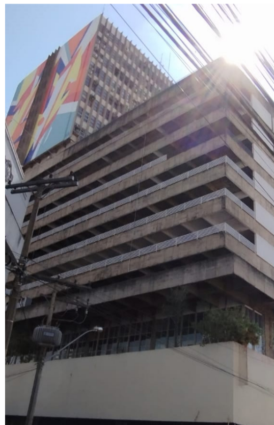
Perspectivas: design desafia normas do passado no Setor Central

de Cultura. Esses espaços são fundamentais para a vida cultural de Goiânia, promovendo exposições e eventos que celebram a arte.