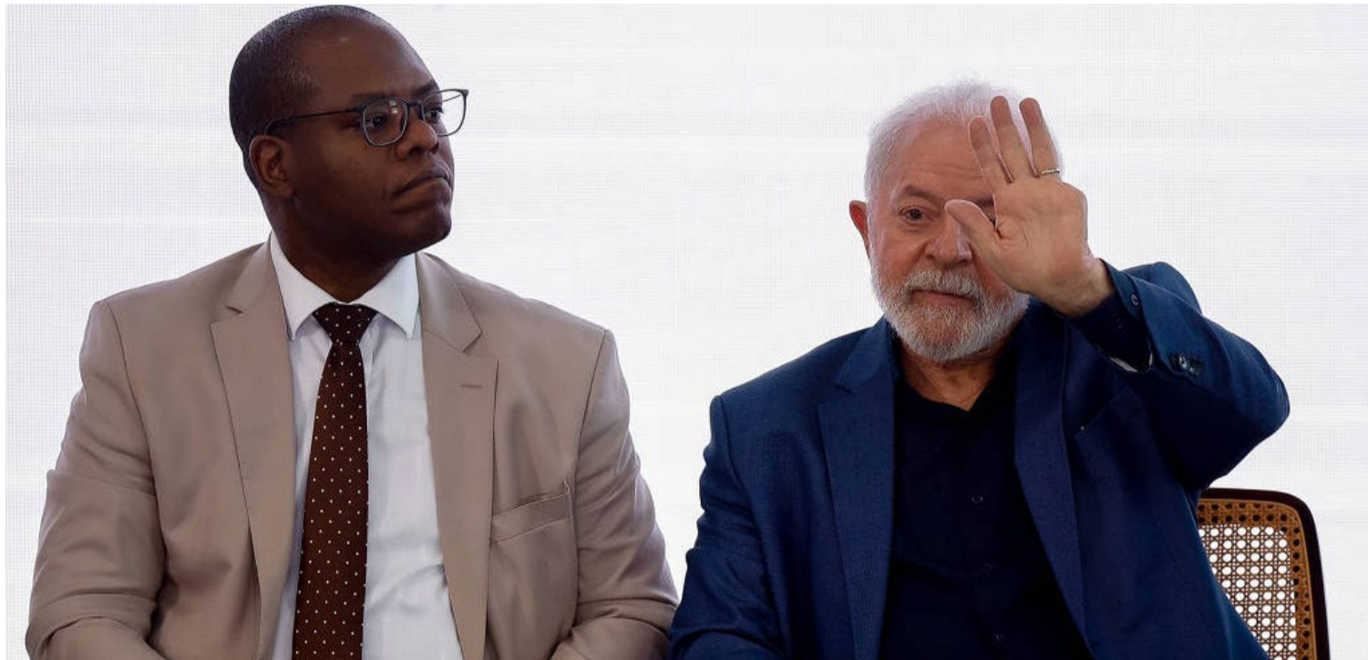
Silvio Almeida e Lula da Silva: governo decide pela demissão do ministro

nota para comunicar oficialmente a decisão.