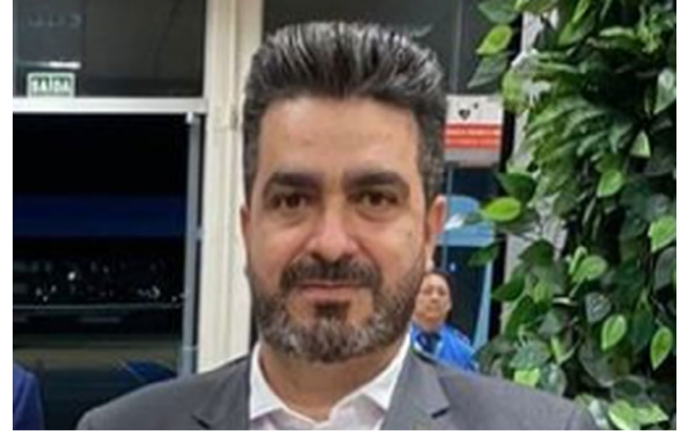
Leonardo Avalanche: falta de pagamentos